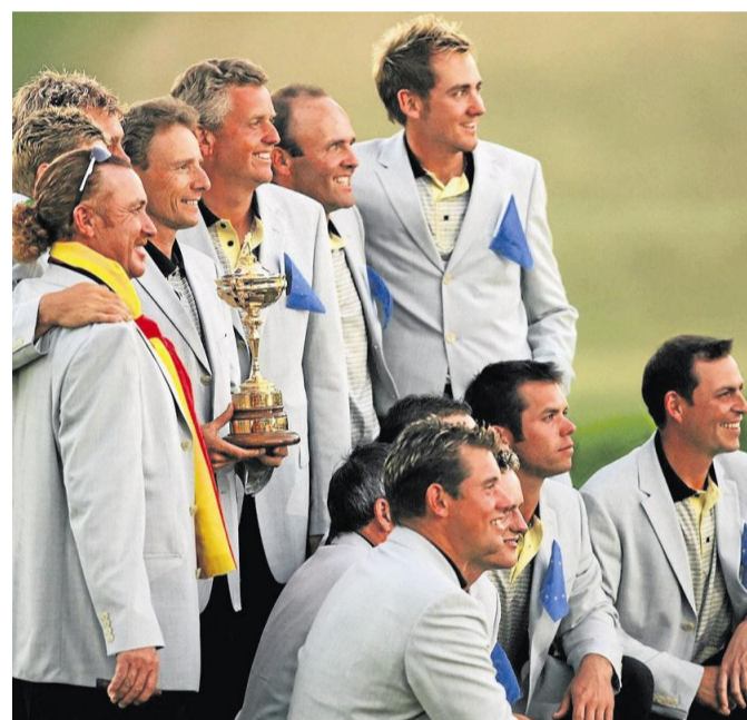
Bernhard Langer (oben 3.v.l.) war Kapitän des europäischen Ryder Cup-Teams 2004 - und holte den Pokal.

Martin Kaymer hat Sie vor seinem Debüt angerufen und um Tipps gebeten. Welche Rolle kann Kaymer in Wales spielen? Und wie sehen Sie seine Entwicklung? Ich traue Martin alles zu. Er hat die Technik, Mentalität und Einstellung sowie das Können und Selbstvertrauen, noch viele große Turniere zu gewinnen und auch in der Weltrangliste ganz nach vorne zu kommen. Er kann auch bei den bevorstehenden Ryder Cup Matches eine wichtige Rolle übernehmen.