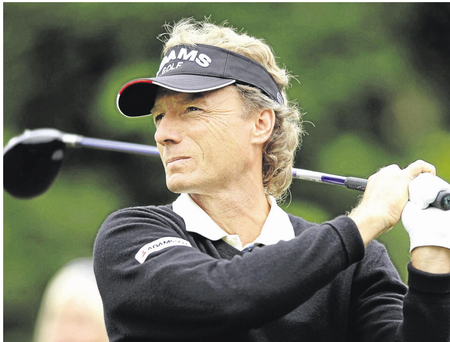
Oldies but Goldies: Bernhard Langer spielte 2010 bislang eine sensationelle Saison mit zwei Major-Siegen in Folge auf der Senioren-Tour.